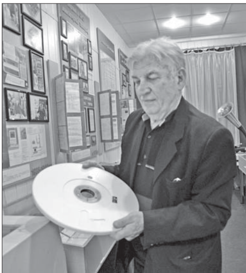
Перший у світі оптичний диск в руках у свого творця