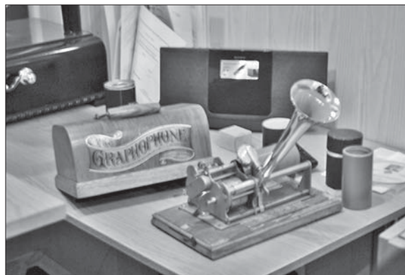
Фонограф Едісона в музеї Інституту проблем реєстрації інформації НАН України