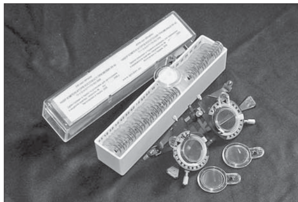
Діагностичний набір для визначення параметрів косоокості

— Надія є завжди. 29 січня цього року відбулося друге засідання Президії НАМН України, присвячене цьому питанню. Доповідали Микола Маркович Сергієнко і я. Було прийнято рішення звернутися від імені НАН України і НАМН України до Міністерства охорони здоров'я з тим, щоб держава виділила кошти для забезпечення всіх дитячих офтальмологів